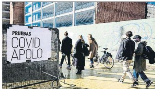
El estudio clínico en la Sala Apolo finalizó sin ningún contagio

Como promotor musical, desde el mes de abril he sido muy activo haciendo propuestas que nos permitieran volver a la actividad de música en vivo y gracias a eso he tenido la oportunidad de ir hablando con algunos de los expertos sanitarios del país. A lo largo de estos meses he entendido que la covid condicionará nuestras vidas hasta que no exista una inmunidad de grupo, cosa que