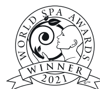
World's Best Spa Brand