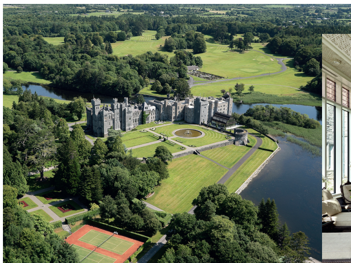
The Ashford Castle Ireland's Best Hotel Spa