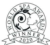
World's Best Spa Brand