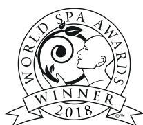
World's Best Spa Brand

Fiel a sus valores de compromiso y solidaridad, la firma crea la Fundación Ricardo Fisas Natura Bissé en el año 2008 para contribuir al bienestar de las personas en situación de vulnerabilidad.