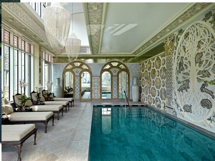
The Spa at Ashford Castle Ireland's Best Hotel Spa