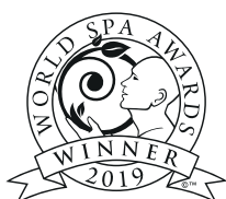
World's Best Spa Brand